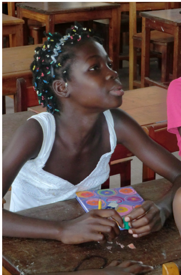
Clairefontaine dans une école en Guinée Equatoriale

De même, il soutient de grandes O.N.G. comme l'UNICEF ou de plus petites comme ELLS (Educació Lleure Salut) qui travaille sur l'éducation en Afrique.